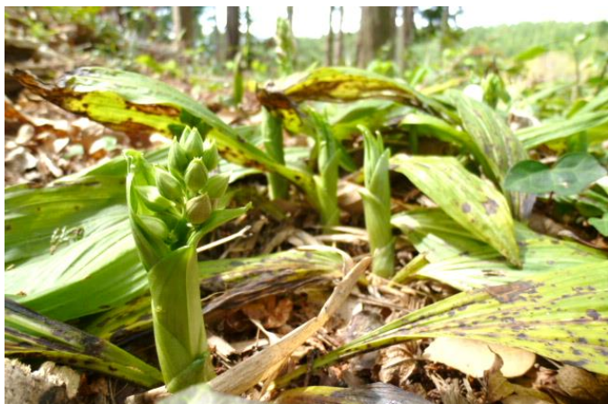
③ エビネの花軸から蕾が伸びてきた。