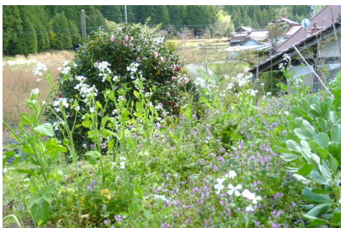
④ 畑に大根の花とホトケノザの花が咲く。右隅にソラマメがいい具合に育っている。