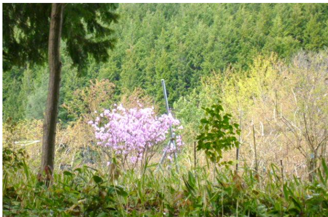
② 山ツツジが1本立ちで満開。